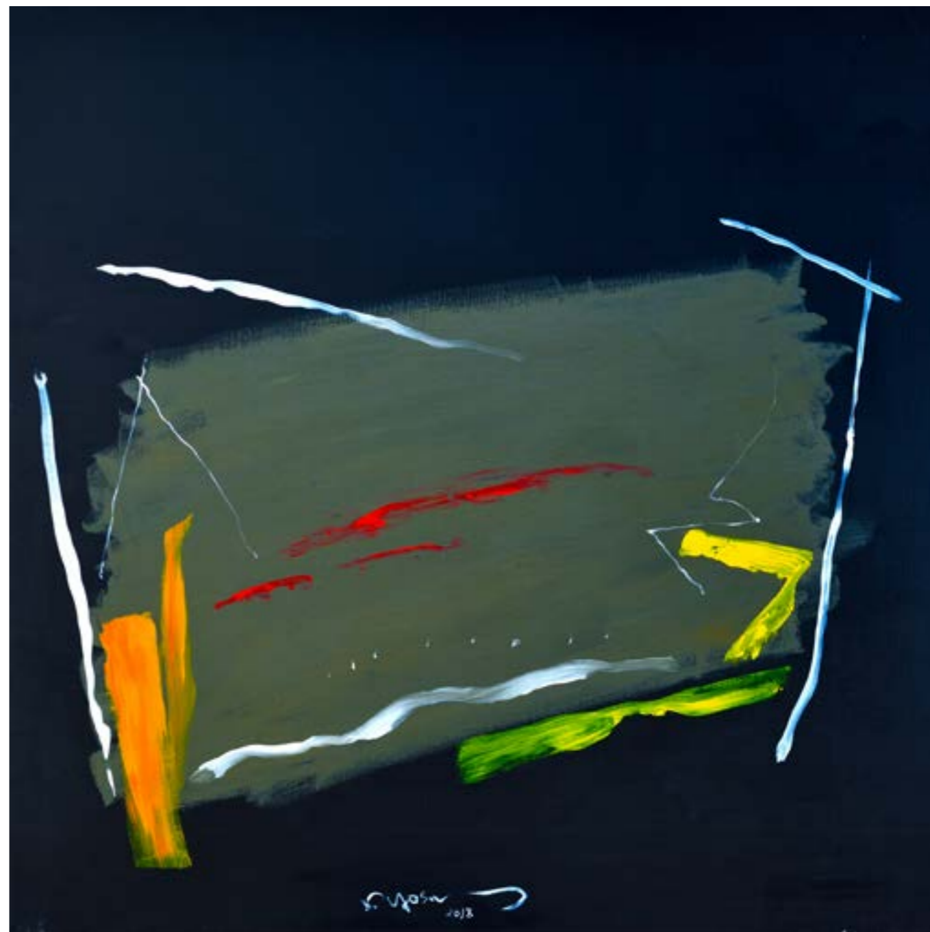
Painting Acrylic on Canvas 120 x 120 cm 2018