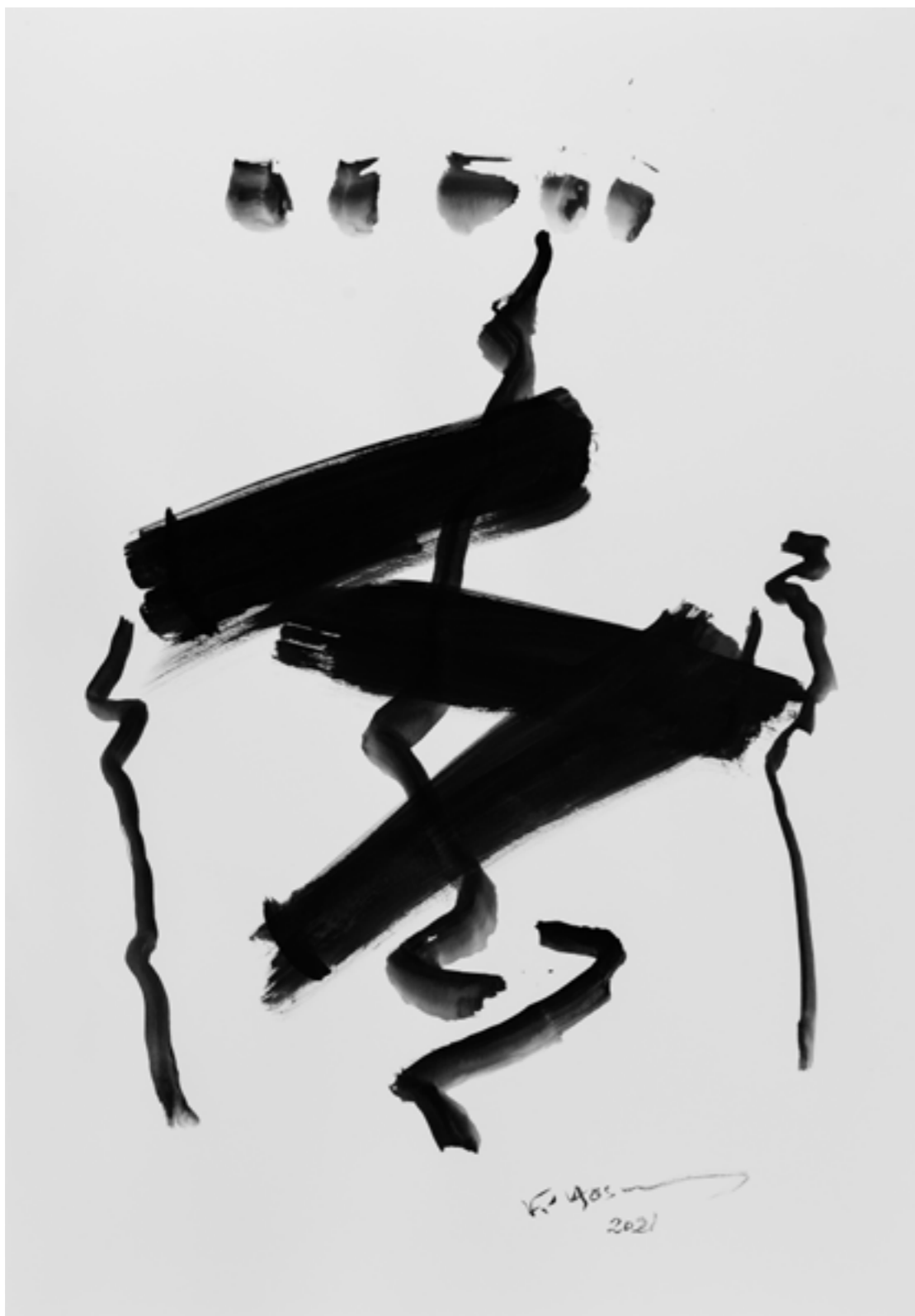
Ink on Paper 70 x 100 cm 2021