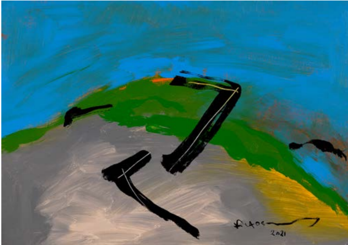
Painting Acrylic on Canvas 50 x 70 cm 2021