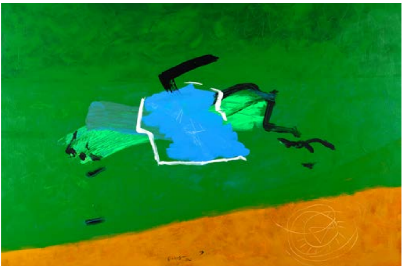
Painting Acrylic on Canvas 120 x 180 cm 2021