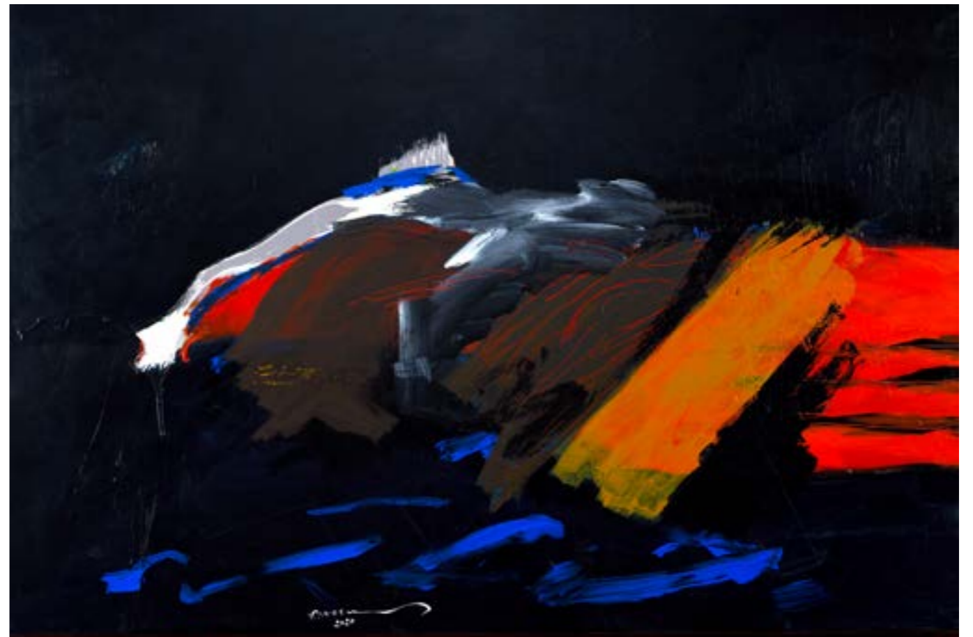
Painting Acrylic on Canvas 100 x 150 cm 2020