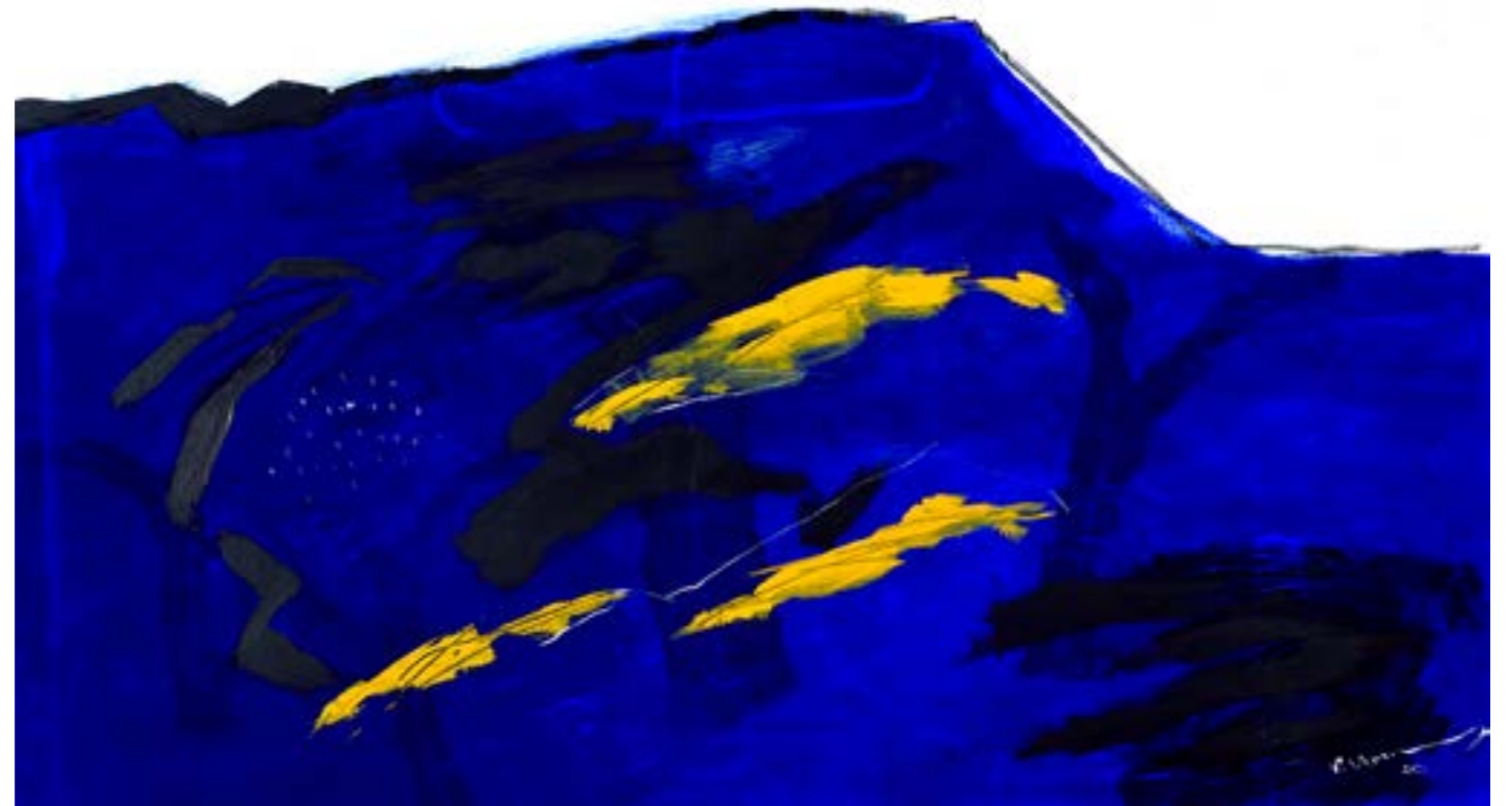
Painting Acrylic on Canvas 120 x 180 cm 2021