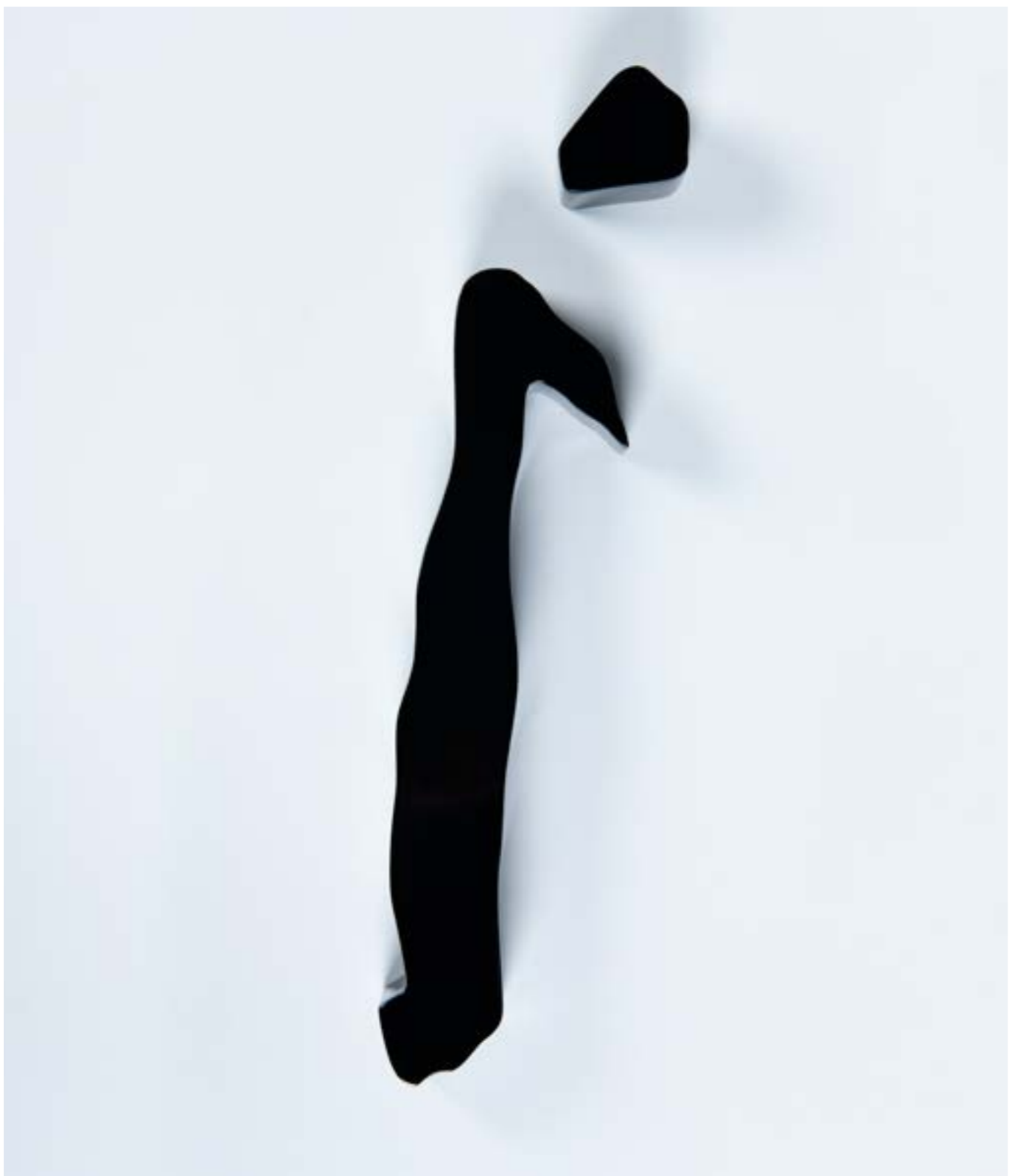
The Point Painting on Aluminum 70 x 50 x 6 cm 2021