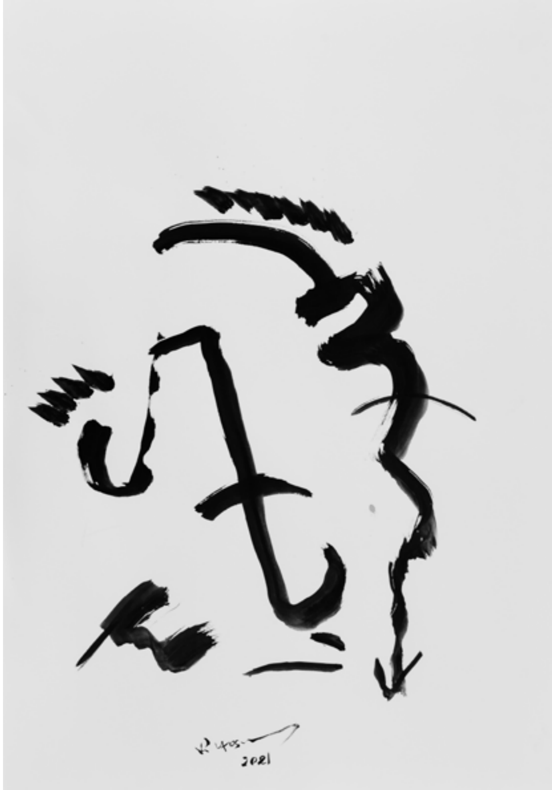
Ink on Paper 70 x 100 cm 2021