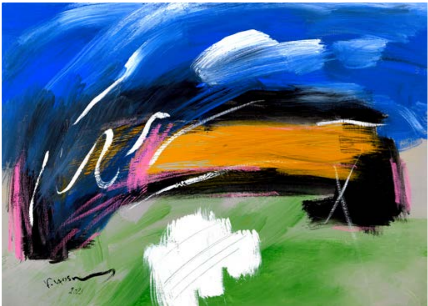
Painting Acrylic on Canvas 50 x 70 cm 2021