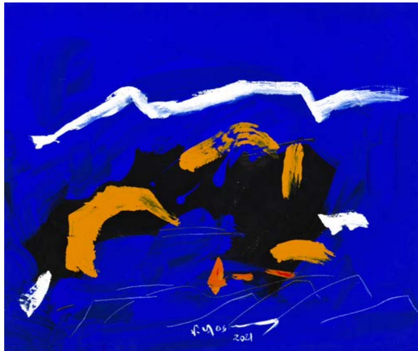
Painting Acrylic on Canvas 120 x 180 cm 2021