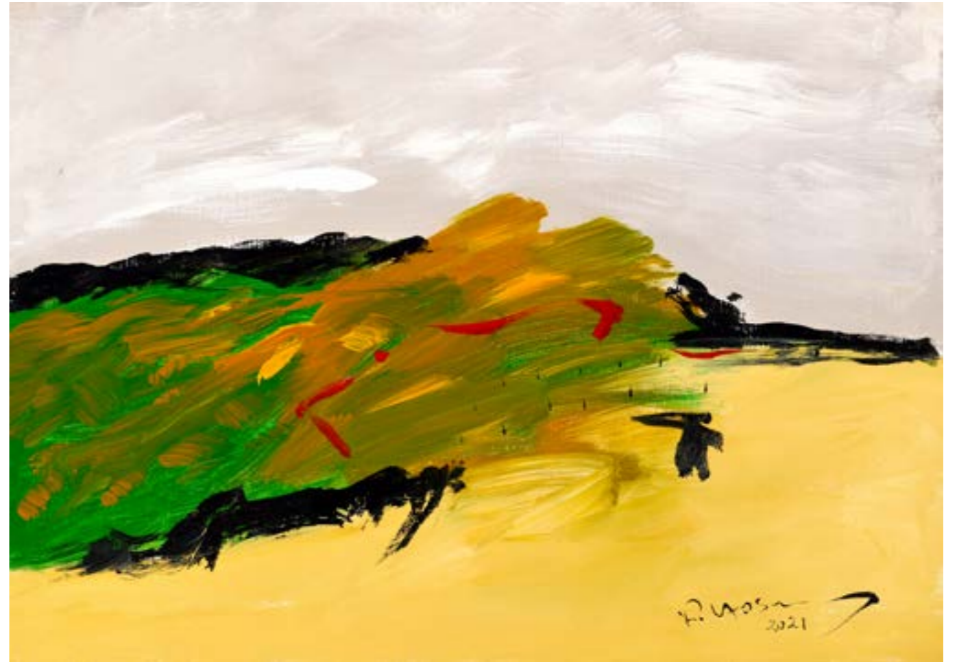
Painting Acrylic on Canvas 50 x 70 cm 2021