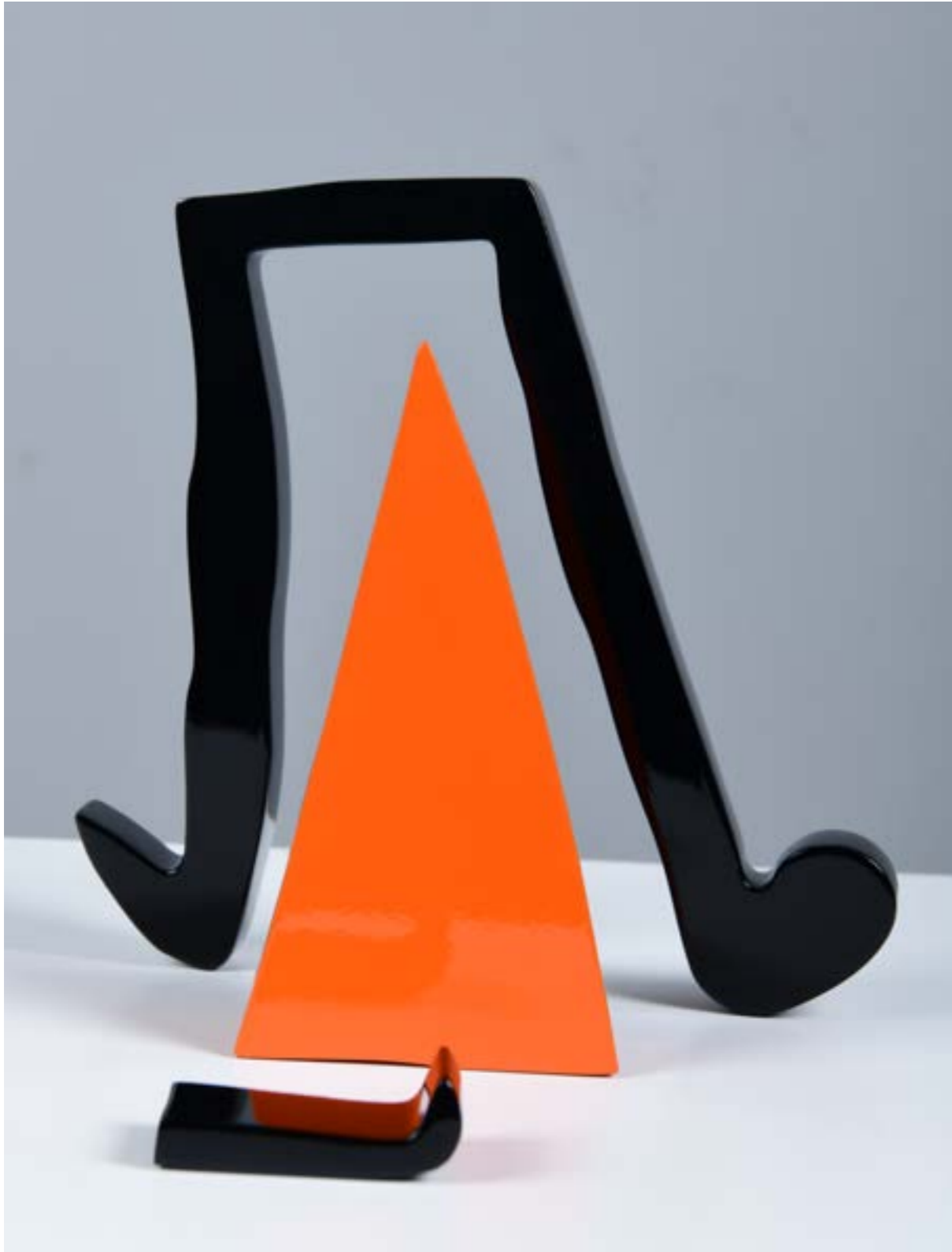
Orange Pyramid Painting on Aluminum 70 x 50 x 6 cm 2021