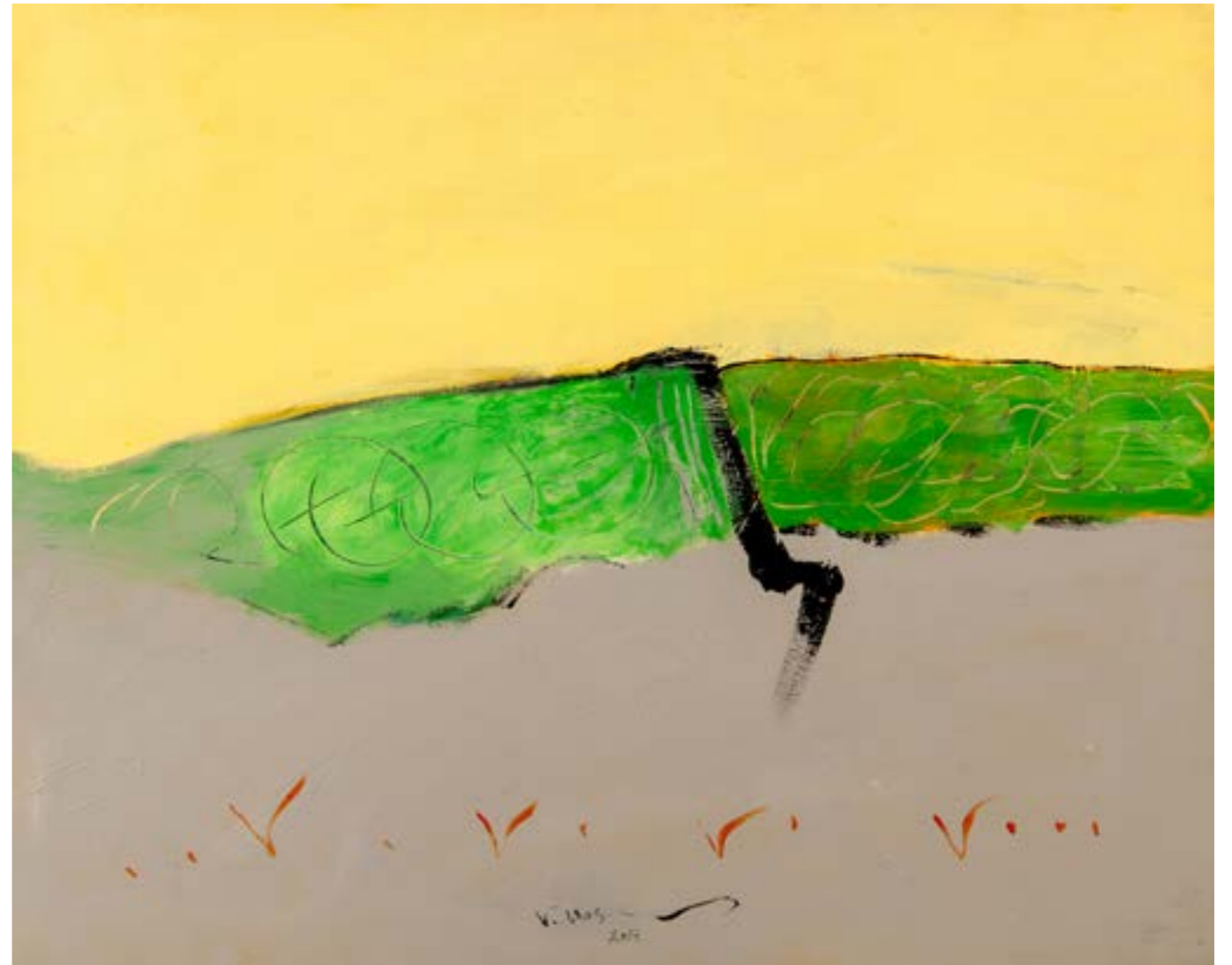
Painting Acrylic on Canvas 80 x 100 cm 2017