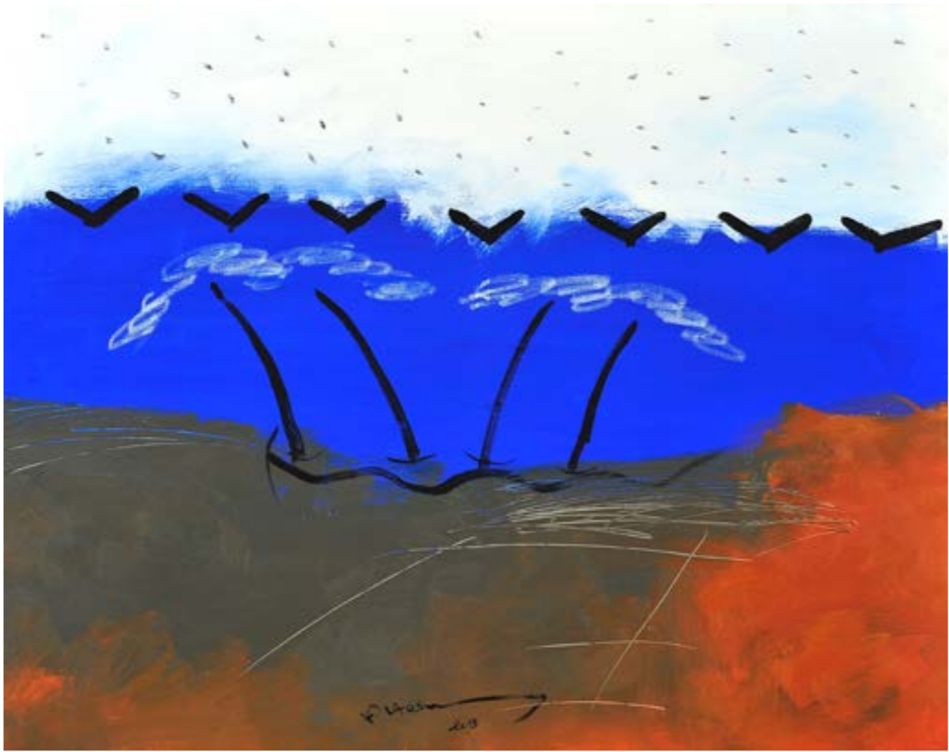
Painting Acrylic on Canvas 80 x 100 cm 2013