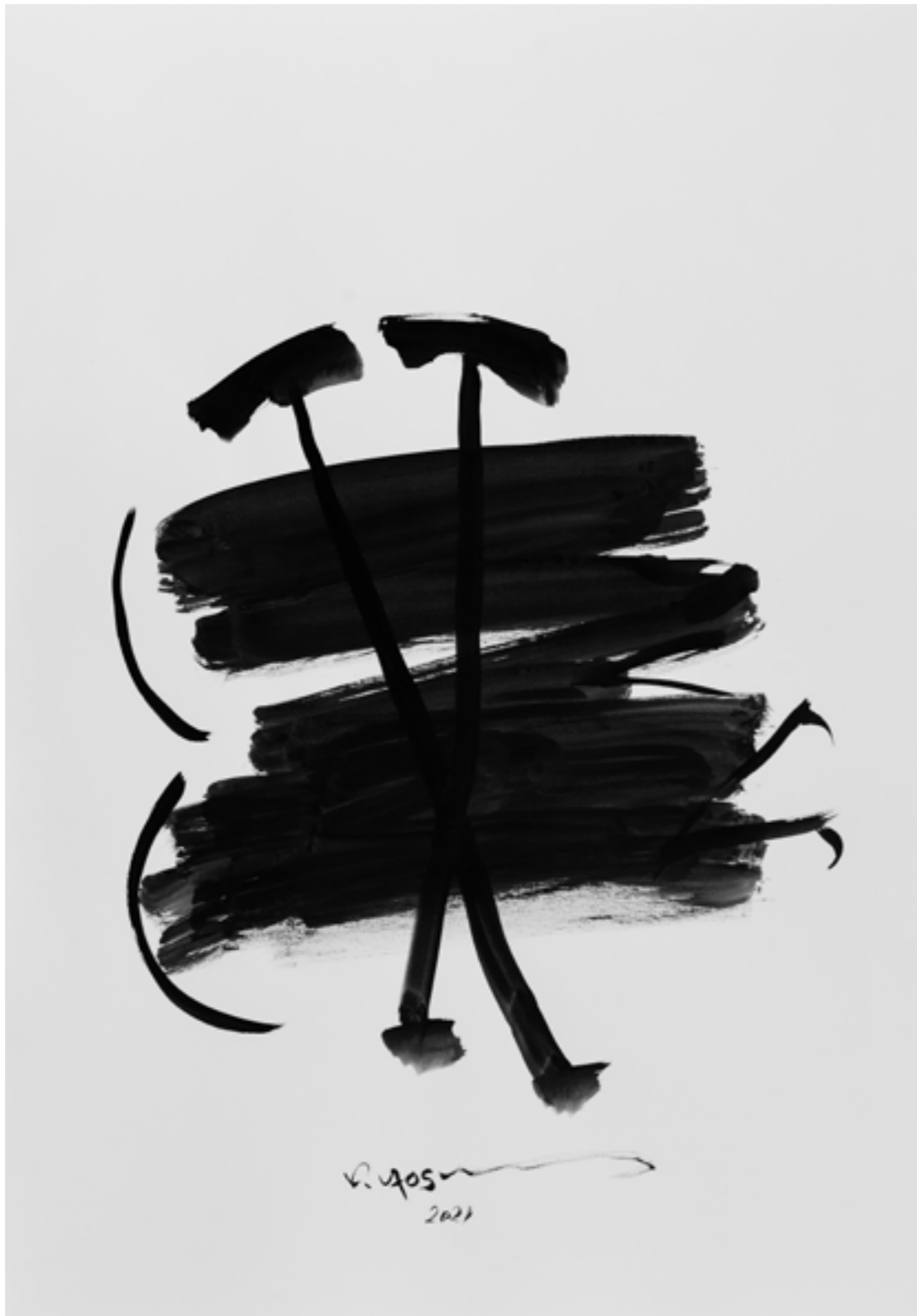
Ink on Paper 70 x 100 cm 2021