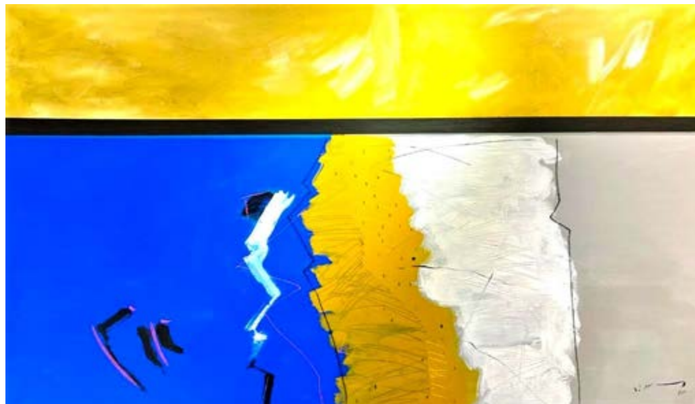
Painting Acrylic on Canvas 120 x 200 cm 2021