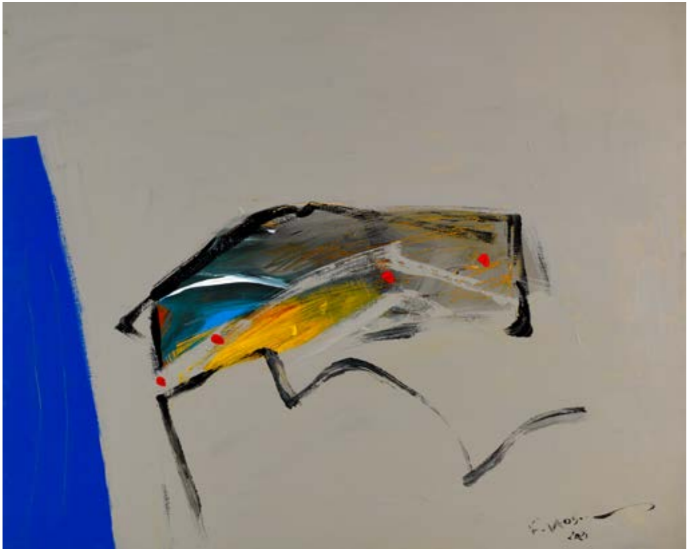
Painting Acrylic on Canvas 80 x 100 cm 2021