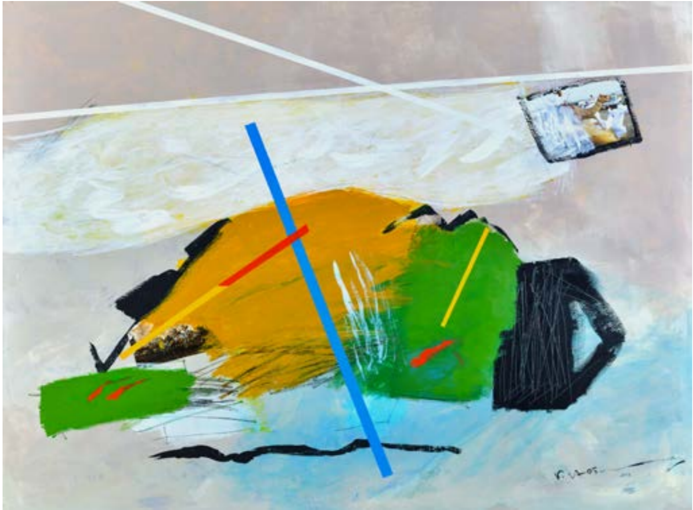
Painting Acrylic on Canvas 150 x 200 cm 2018