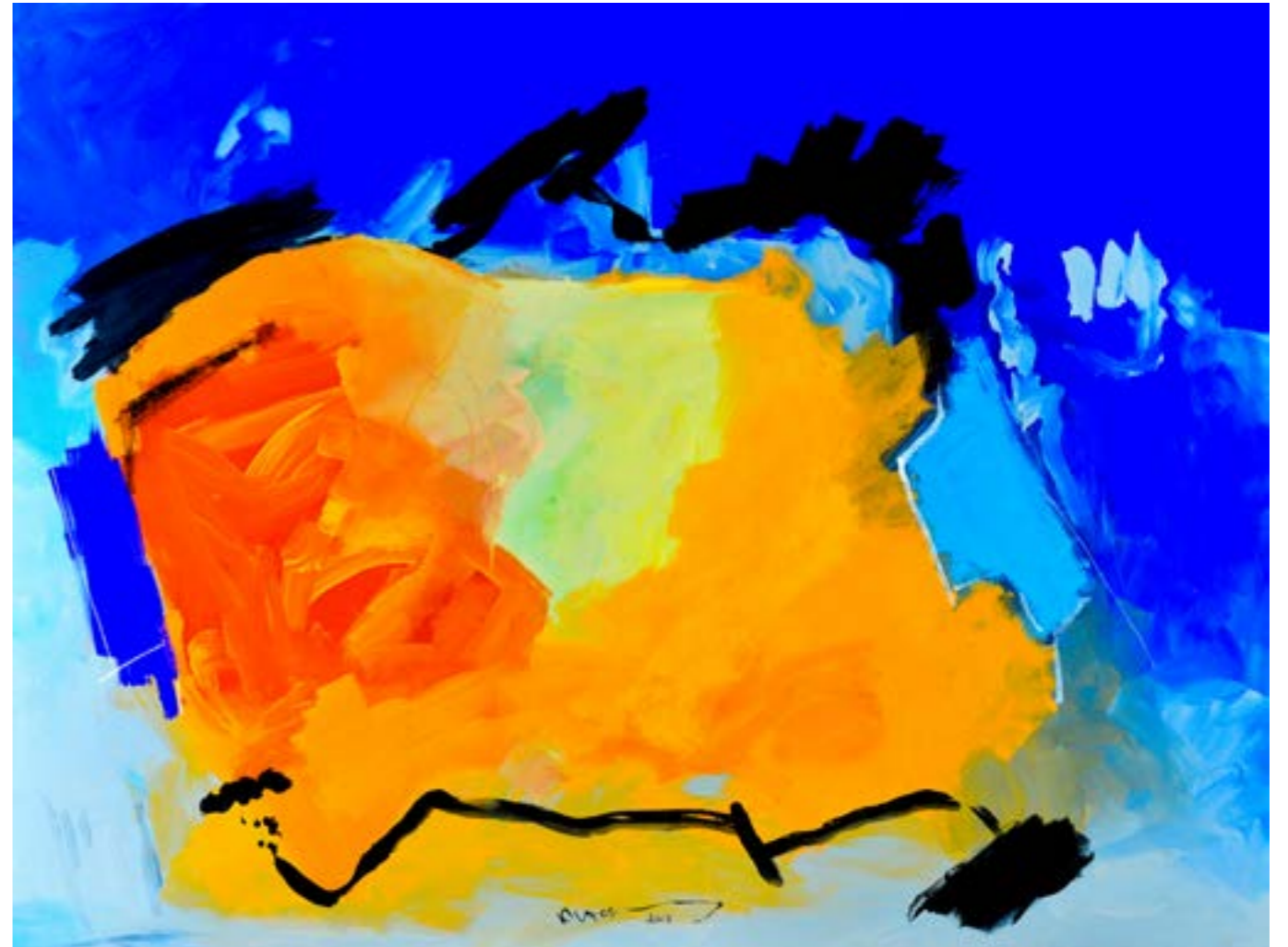
Painting Acrylic on Canvas 150 x 200 cm 2018