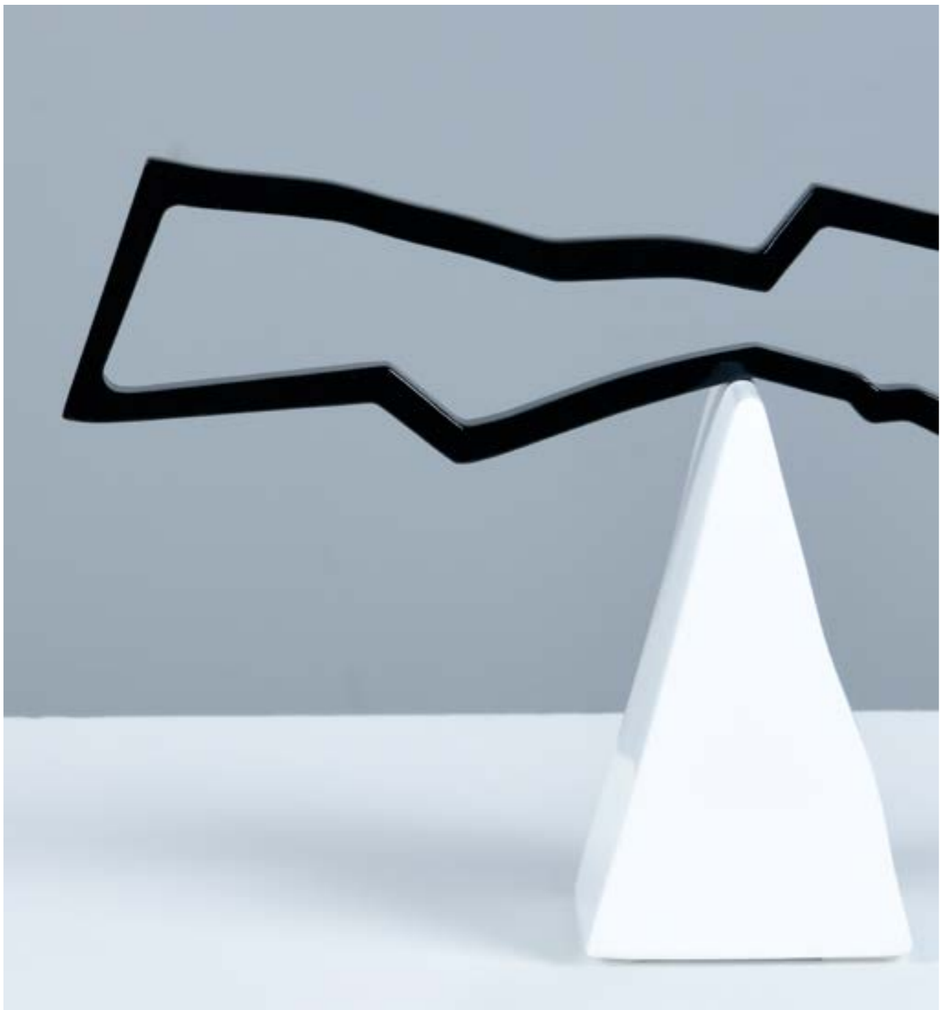
The Balance Painting on Aluminum 70 x 50 x 6 cm 2021