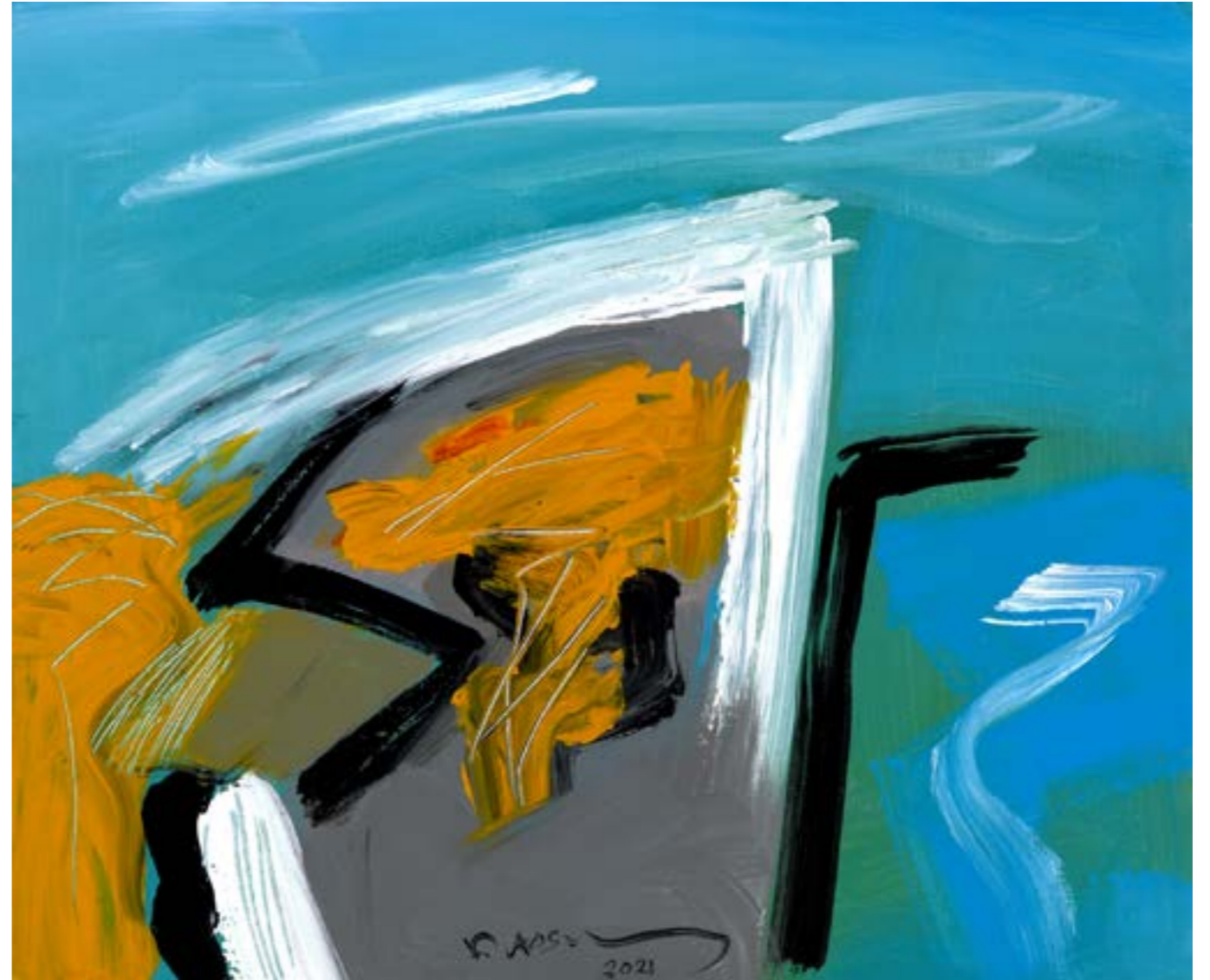
Painting Acrylic on Canvas 50 x 60 cm 2021