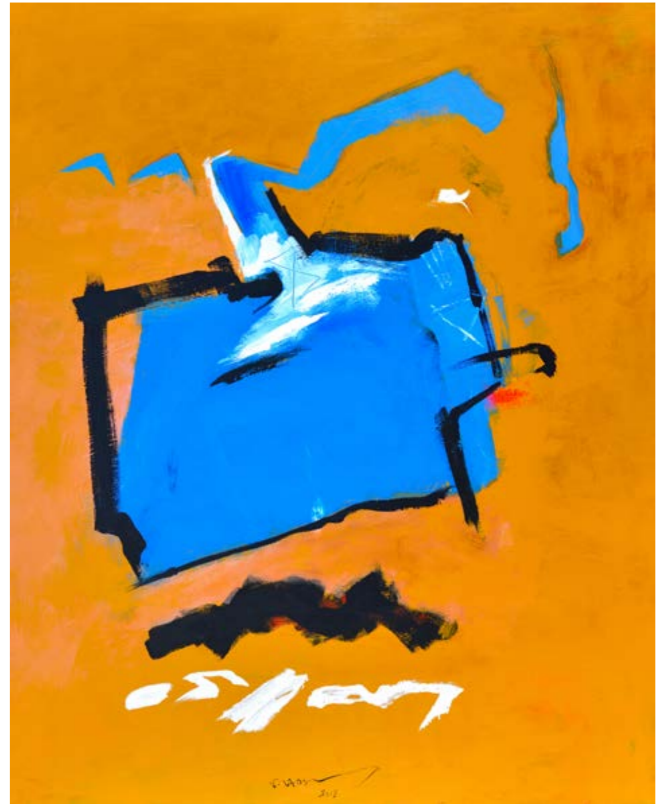
Painting Acrylic on Canvas 150 x 120 cm 2018