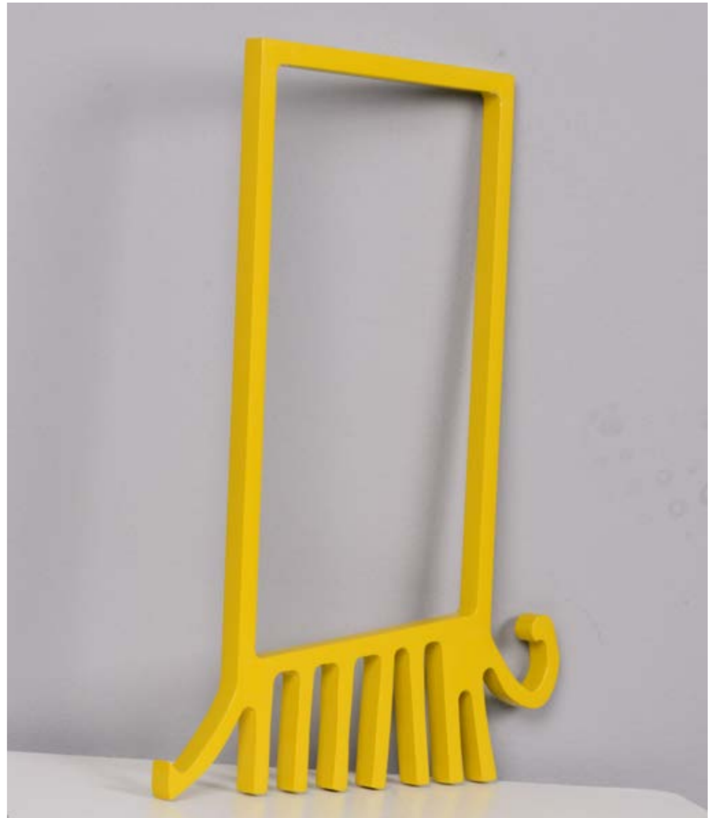
Modern Window Painting on Aluminum 70 x 50 x 6 cm 2021