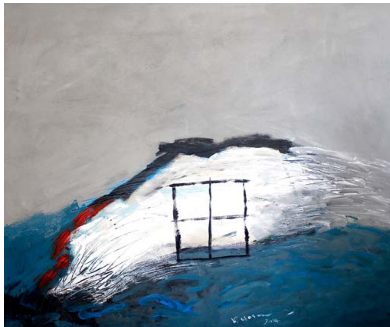
Painting Acrylic on Canvas 100 x 120 cm 2014