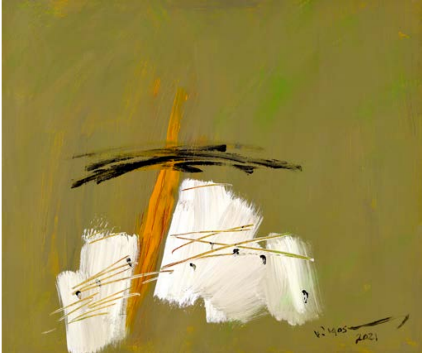
Painting Acrylic on Canvas 50 x 60 cm 2021