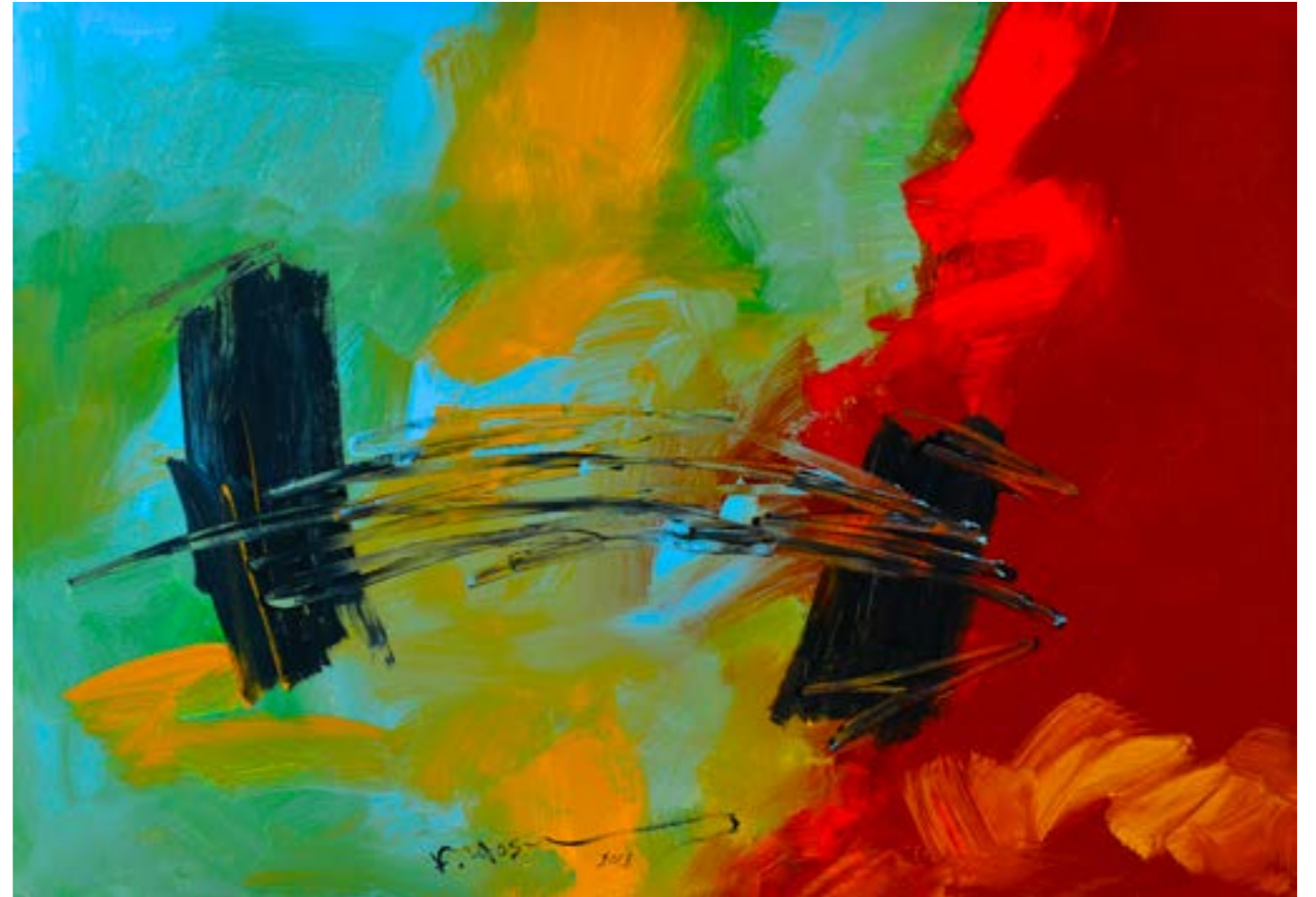
Painting Acrylic on Canvas 70 x 100 cm 2018