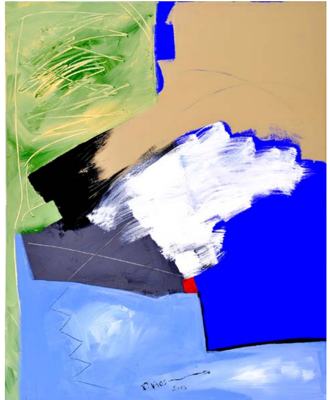
Painting Acrylic on Canvas 100 x 80 cm 2013