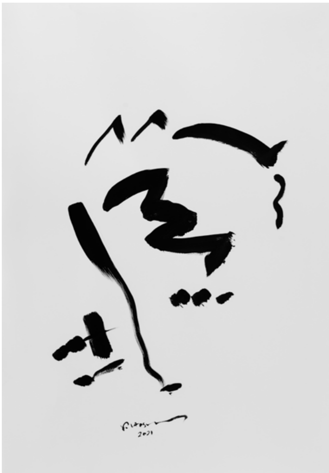
Ink on Paper 70 x 100 cm 2021