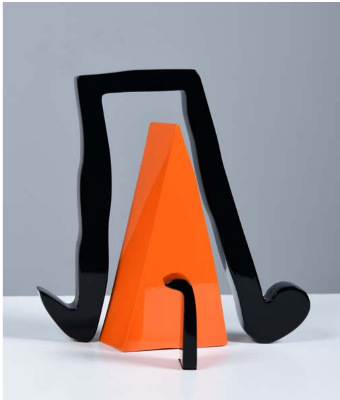
Orange Pyramid Painting on Aluminum 70 x 50 x 6 cm 2021