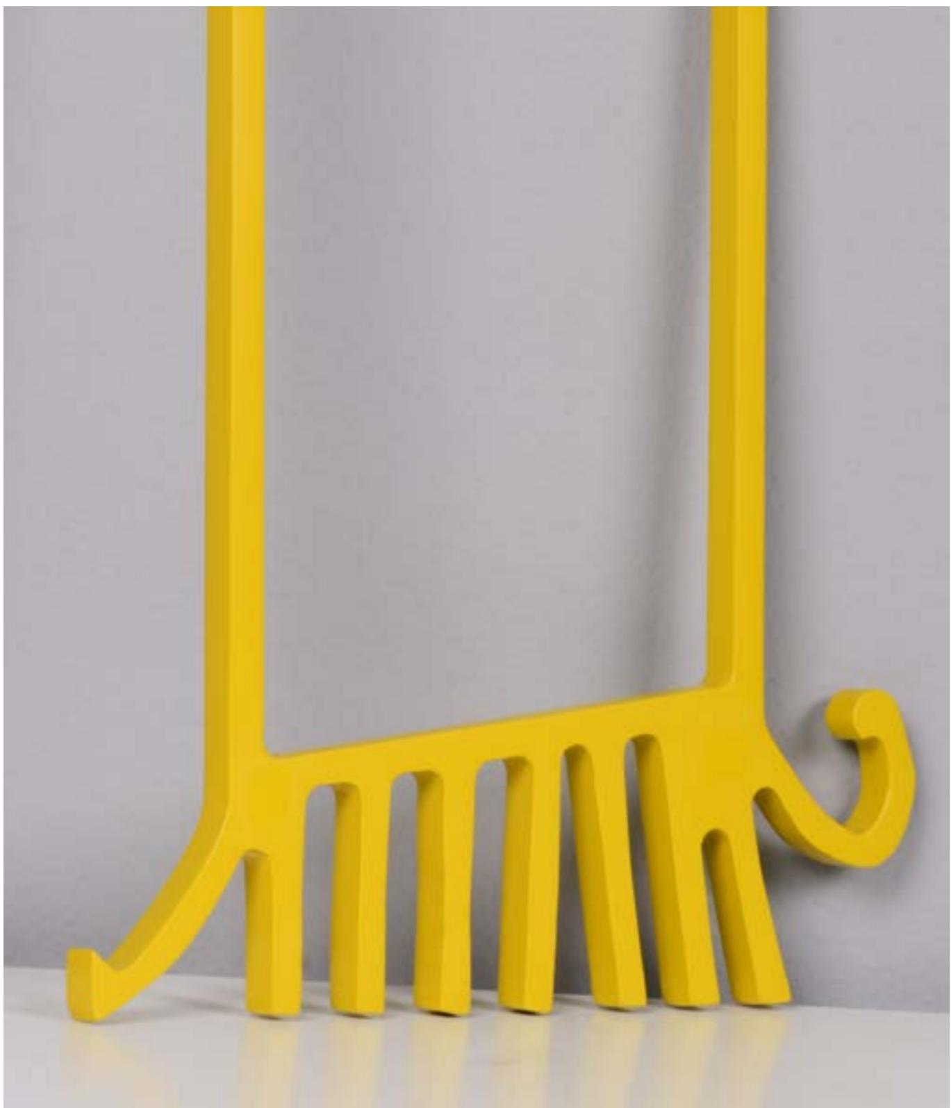
Modern Window Painting on Aluminum 70 x 50 x 6 cm 2021