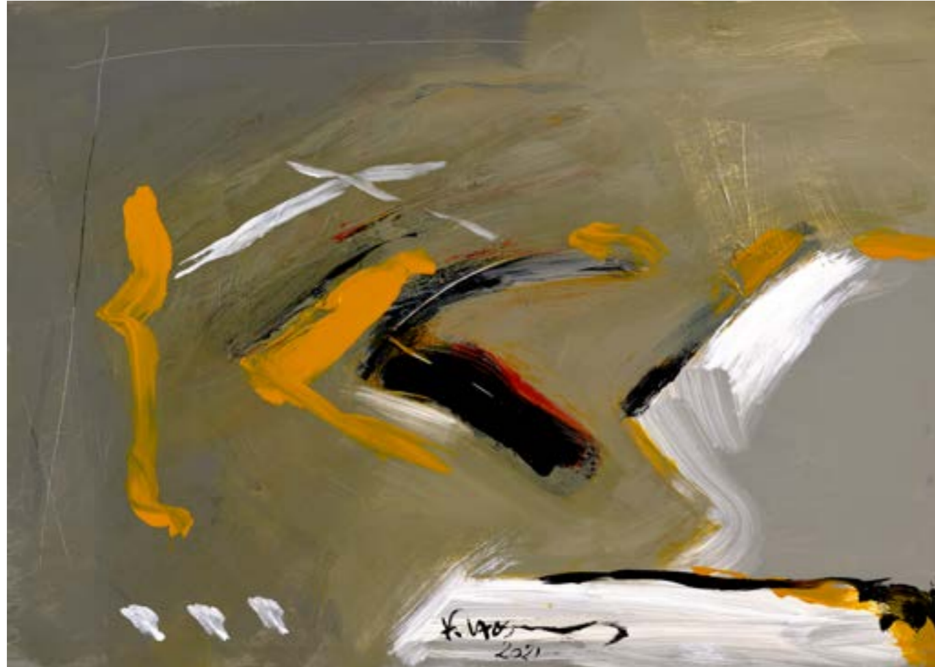
Painting Acrylic on Canvas 50 x 70 cm 2021