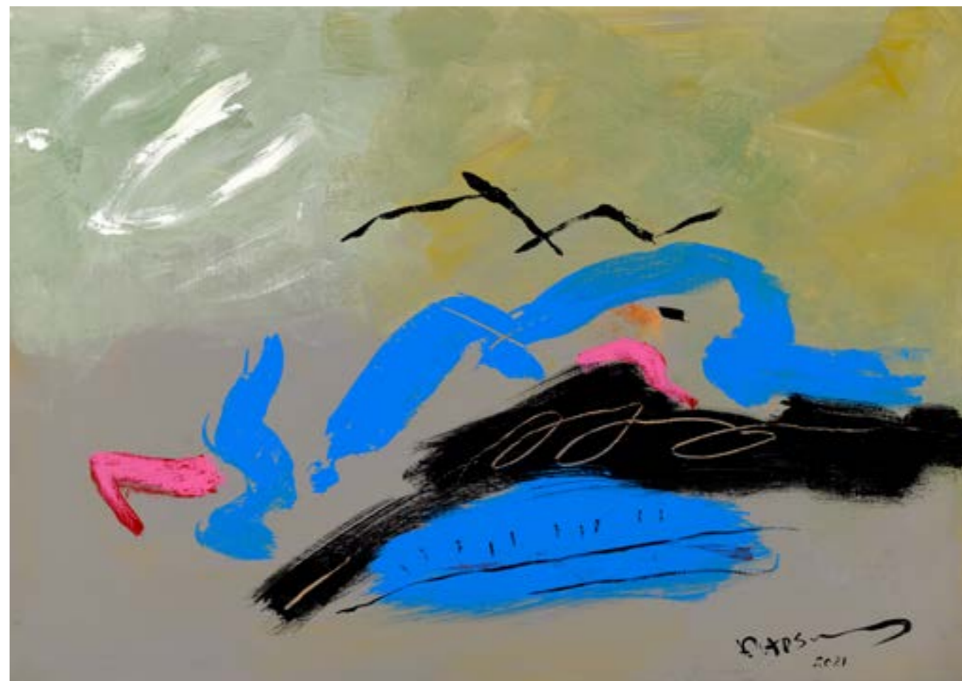
Painting Acrylic on Canvas 50 x 70 cm 2021