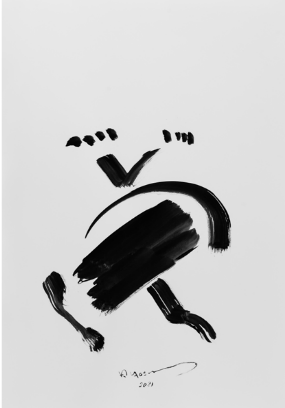
Ink on Paper 70 x 100 cm 2021