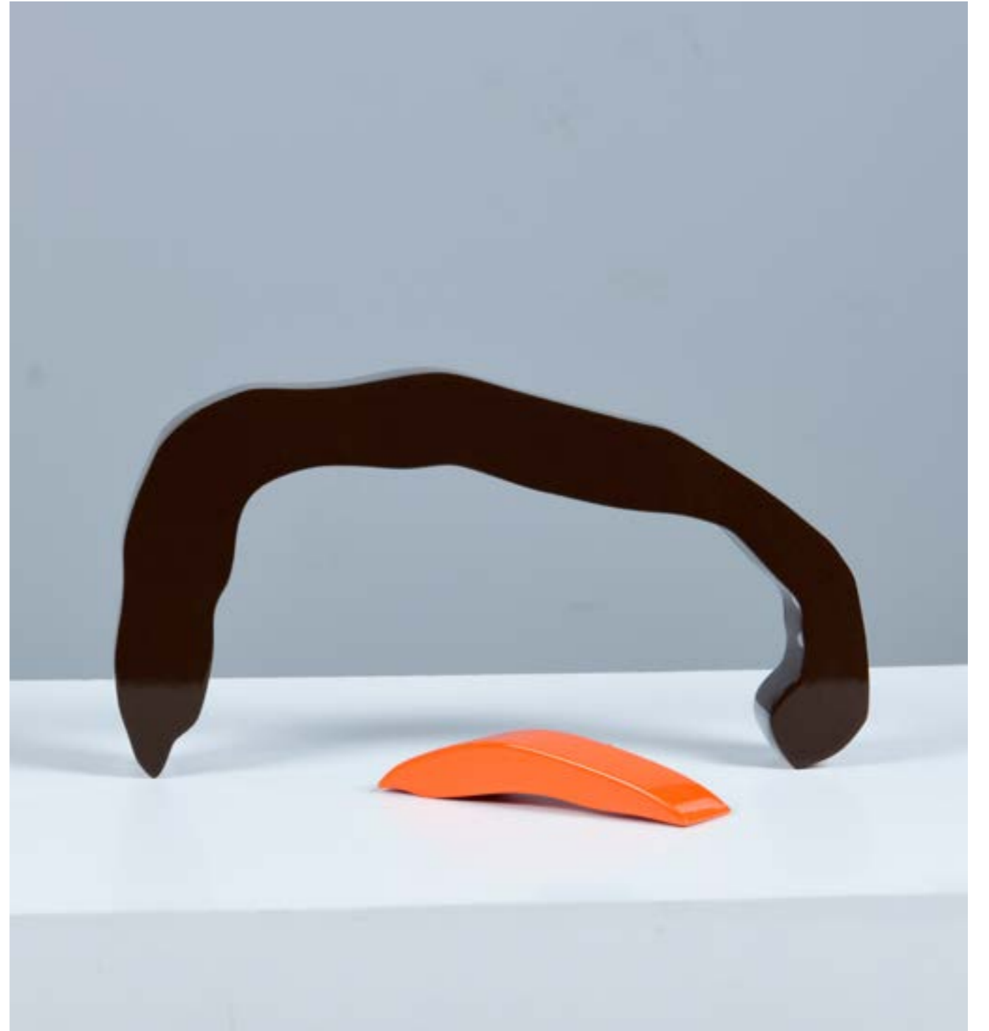
Relationship Painting on Aluminum 70 x 50 x 6 cm 2021