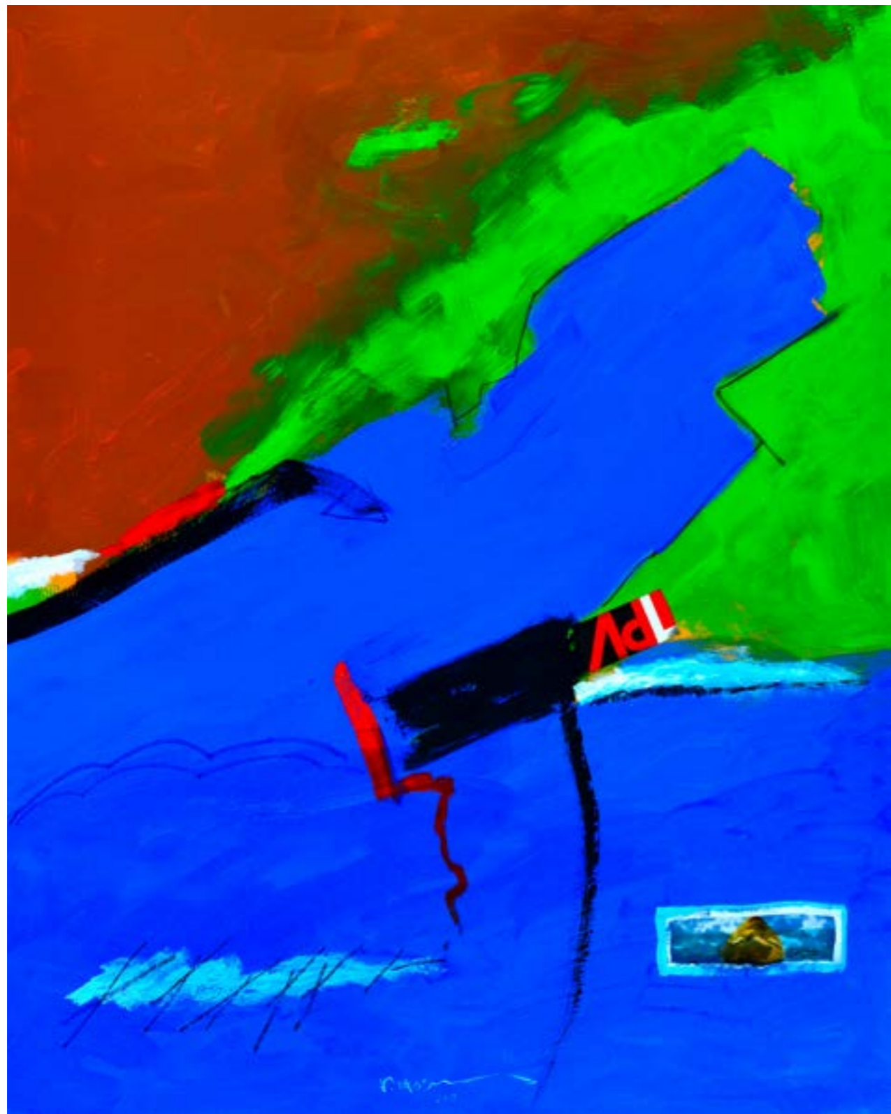
Painting Acrylic on Canvas 150 x 120 cm 2018